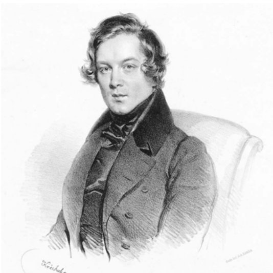
„Robert Schumann“, Lithografie von Joseph Kriehuber, 1839.

le erinnert mit ihren Anspielungen auf die Themen der ersten Sätze an Beethovens Neunte. Das energische Hauptthema greift den herben Mollton von Schumanns kurz zuvor komponierten „Stücken im Volkston“ für Cello und Klavier auf. Ein Beispiel für die Verwebung zwischen Cello und Orchester bietet die Durchführung des Finales, in dem sich das Solo-Cello dem Orchester als Begleitinstrument unterordnet, indem es eine motivische Floskel vielfach in verschiedenen Lagen wiederholt. Eine frei gestaltete Solokadenz verwehrt Schumann dem Solisten und schickt dem Schluss des Finales stattdessen eine von ihm komponierte Kadenz voraus, in der das Spiel des Solo-Cellos von Akkorden der Streichergruppe gestützt wird.